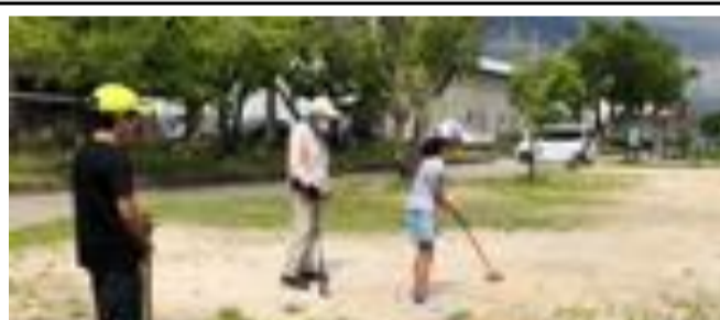
グラウンド ゴルフ